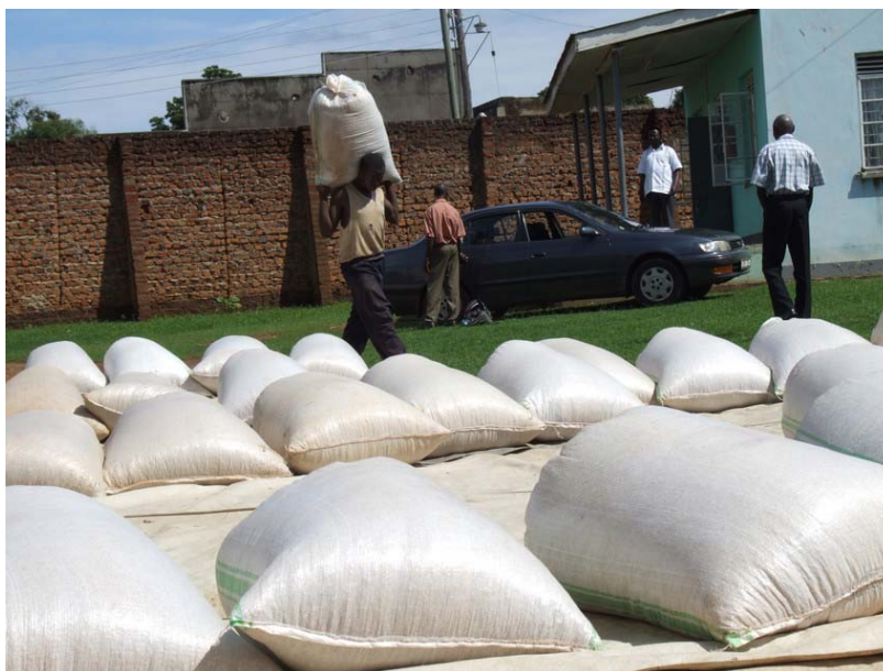
Instalaciones de la cooperativa Gumutindo en Uganda

Los miembros de la cooperativa Gikanda en Kenya han renovado su planta procesadora de café y están invirtiendo en mejorar la calidad y la productividad. Un nuevo consultorio proporciona atención sanitaria asequible para pacientes que de otro modo estarían forzados a enfrentarse a una caminata de 8 km hasta el dispensario más cercano, y aulas de la escuela han sido renovadas y ampliadas, permitiéndoles matricular a más alumnos.